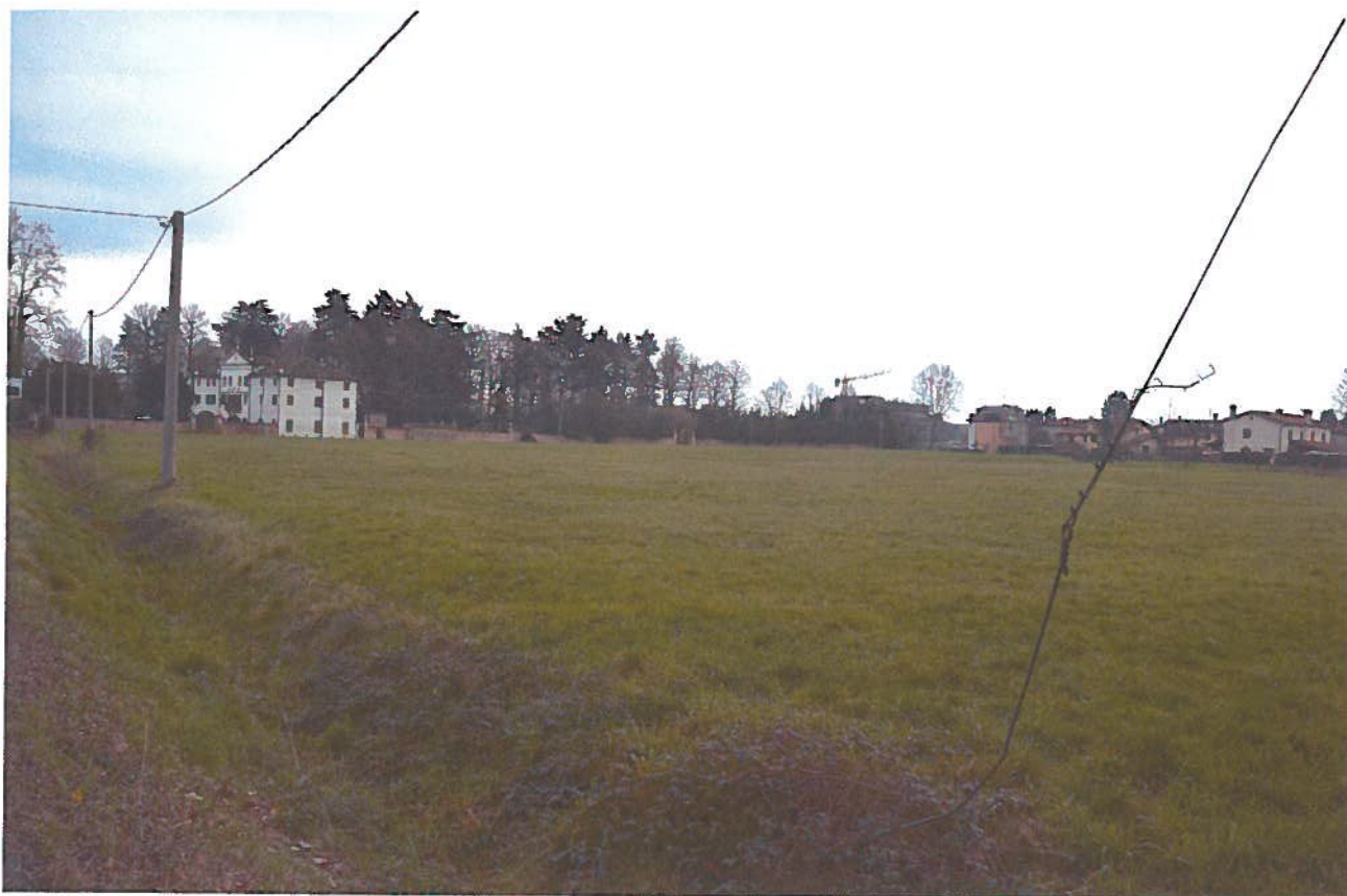
Foto da Via Roma Verso Villa Zanga e Via Ghetto

L'intervento consisterà nell'allargamento dell'asse stradale di via Ghetto, che comporterà il nuovo risezionamento del fossato adiacente alla strada per consentire al meglio la circolazione nel doppio senso di marcia. L'ingresso alla lottizzazione avverrà da via Ghetto attraverso un ponte e a un piccolo tratto stradale ad uso privato che termina con un "cul de sac", che permetterà la viabilità anche dei mezzi di trasporti per il servizio dello smaltimento rifiuti.